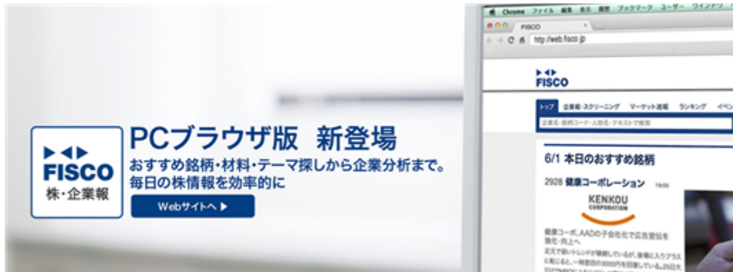
FISCOウェブ ( https://web.fisco.jp/ )

SJIでは、有利子負債の圧縮をはじめとする財務改善策を着実に進めてまいりました。さらなる財務体質の改善に向け、金融機関との取引正常化交渉をはじめとして、徹底した経費削減を行うと同時に、本格的な成長に向け、業務を推進してまいりました。具体的には、既存顧客への積極的な営業活動や提案活動に加え、グループ横断的な営業活動を行うことで新規顧客の開拓を促進しております。また、優秀な人材の確保に努めるとともに、ビジネスパートナー（発注先）の開拓促進にも注力いたしました。これらの施策を行った結果、SJIの従来からの得意分野である金融業界・情報通信業界向け案件が好調に推移している事に加え、サービス業界向け案件も好調であり、売上高は計画を上回るペースで進捗いたしました。利益面においても計画を上回るペースで進捗しており、平成28年10月期第1四半期より、営業利益、経常利益、親会社株主に帰属する四半期純利益ともに黒字転換いたしました。